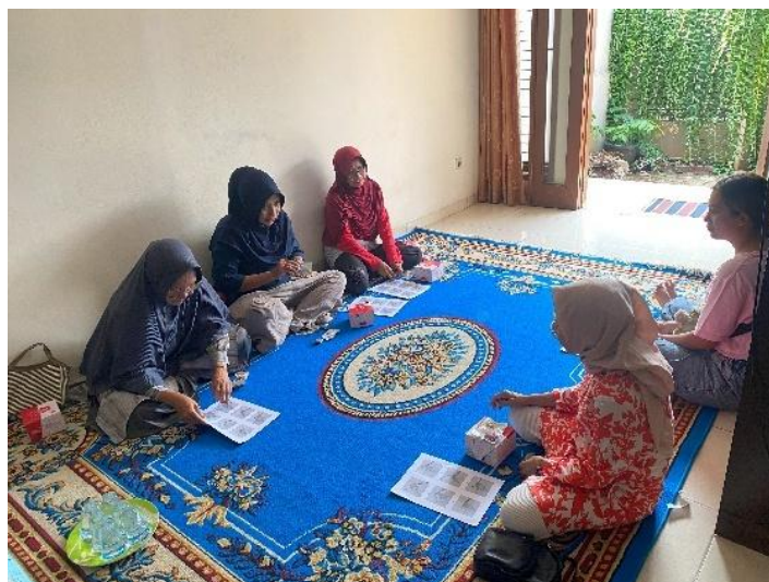
Gambar 1. Pembelajaran modul ajar rajutan

Kurangnya kemahiran anggota pelaksana kegiatan sehingga hanya beberapa orang saja yang dapat membantu peserta yang kurang mahir dalam melakukan praktek pembuatann bros hijab rajutan ini. Namun hal ini tidak menjadi hambatan yang cukup besar bagi penulis karena jumlah peserta hanya 8 orang dan 2 orang peserta yang sudah mahir dalam merajut ikut serta membantu dalam membantu peserta lain yang masih dalam tahap belajar membuat bros hijab dari rajutan. Sarana dan prasaran yang dibutuhkan selama kegiatan tersebut sudah terpenuhi, dengan fasilitas-fasilitas yang telah disediakan oleh pimpinan Cabang Muhammadiyah Cipayung yang ada di Rumah Qur'an, maka dari itu kegiatan yang dilaksanakan dapat berjalan secara maksimal dan peserta lebih mudah memahami materi yang di sampaikan selama kegiatan