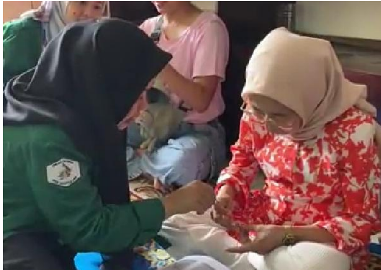
Gambar 2. Praktek langsung membuat bros hijab rajutan

Setelah kegiatan inti pembuatan bros rajutan dan beberapa peserta berhasil membuat bros rajut setelah itu lanjut ke acara penutupan. Pada penutupan kami mengucapkan terima kasih kepada peserta yang telah mengikuti rangkaian kegiatan dari awal hingga akhir, dan di lanjut dengan kegiatan dokumentasi hingga acara selesai. Beberapa kendala yang di alami pada saat kegiaitan berlangsung yaitu terget peserta pada awal pendaftaran yaitu total 12 peserta dengan target 20 peserta. Namun setelah hari pelaksanaan kegiatan total peserta yang hadir yaitu 8 peserta dan 4 peserta berhalangan hadir.