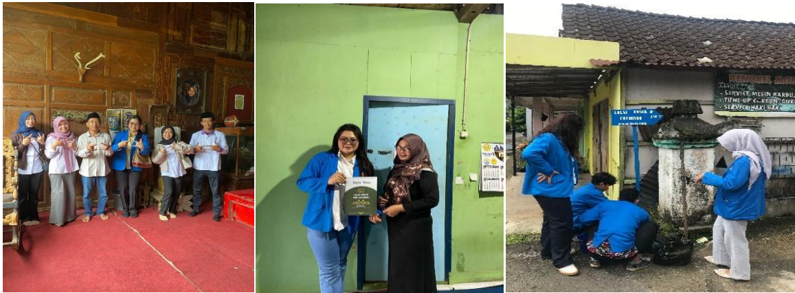
Gambar 3. Kegiatan pendampingan label halal, pembukuan sederhana, Pembuatan Katalog Digital dan Pemasangan Plang

menunjukkan bahwa keberadaan plang penunjuk jalan memberikan akses bagi konsumen dalam menemukan lokasi usaha serta memudahkan mitra dalam memberikan informasi lokasi kepada pelanggan.