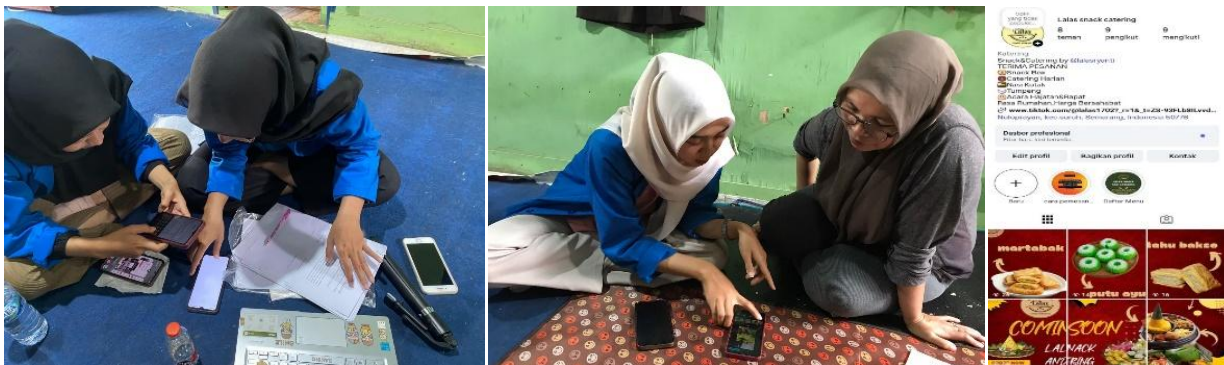
Gambar 2. Kegiatan pendampingan pembuatan akun dan pelatihan konten

Program kerja penguatan promosi digital ini dilakukan sebagai upaya mengatasi keterbatasan mitra dalam memanfaatkan media digital sebagai sarana promosi usaha. Kegiatan ini dilakukan melalui pembuatan dan pendampingan pengelolaan akun media sosial instagram usaha, pelatihan pembuatan konten sederhana, penyusunan konsep feeds yang disesuaikan dengan karakter produk UMKM, serta strategi penyampaian informasi produk dalam media sosial. Pendampingan dilakukan secara aplikatif dengan melibatkan mitra secara langsung dalam praktik pembuatan konten dan pengelolaan unggahan.