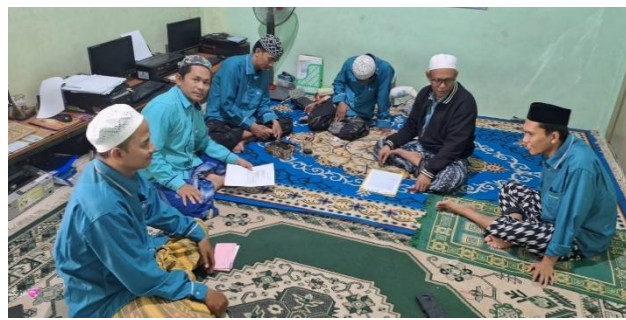
Gambar 2. Monitoring dan evaluasi